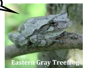
Eastern Gray Treefrog

¿Dónde pasan las ranas la mayor parte de su tiempo? ¿Cómo puedes saber si hay más de una rana?