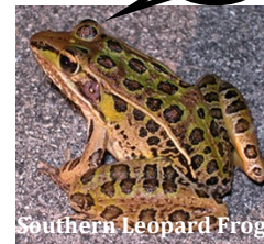
Southern Leopard Frog